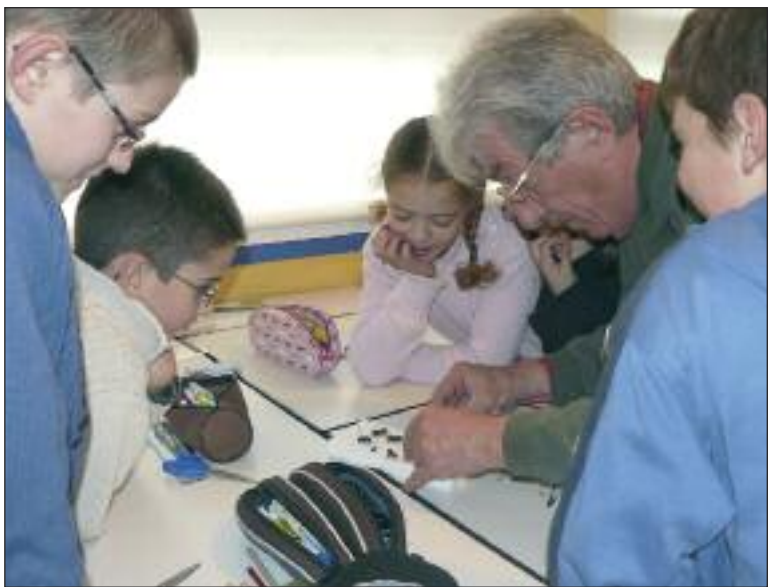
Leçon de choses