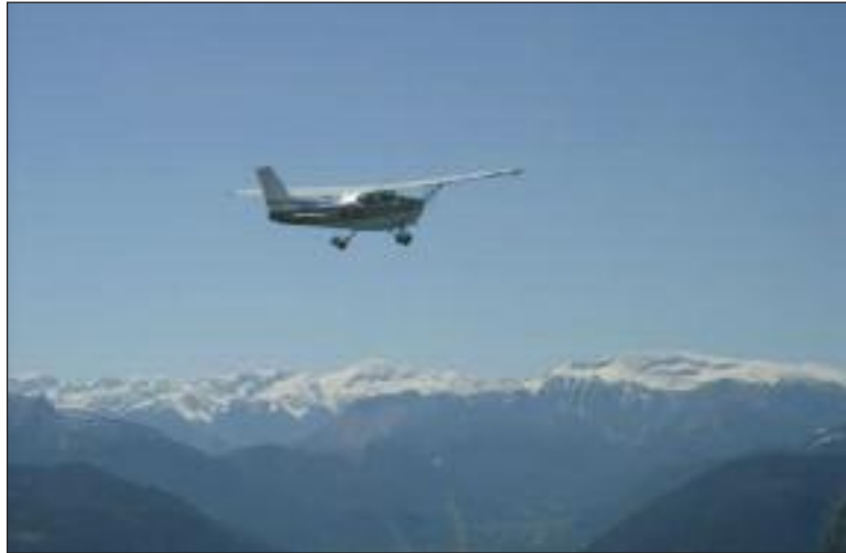
Le survol de l'Atlas marocain par le Cessna 172 du club, c'est encore une belle aventure comme aux temps de l'Aéropostale

Peut-être avez-vous déjà vu ou découvrirez-vous ces jours prochains sur vos petits écrans ce spot de quinze secondes proposé par la Fédération française aéronautique et qui se termine ainsi : " Devenir pilote, ce n'est pas une idée en l'air ! ".