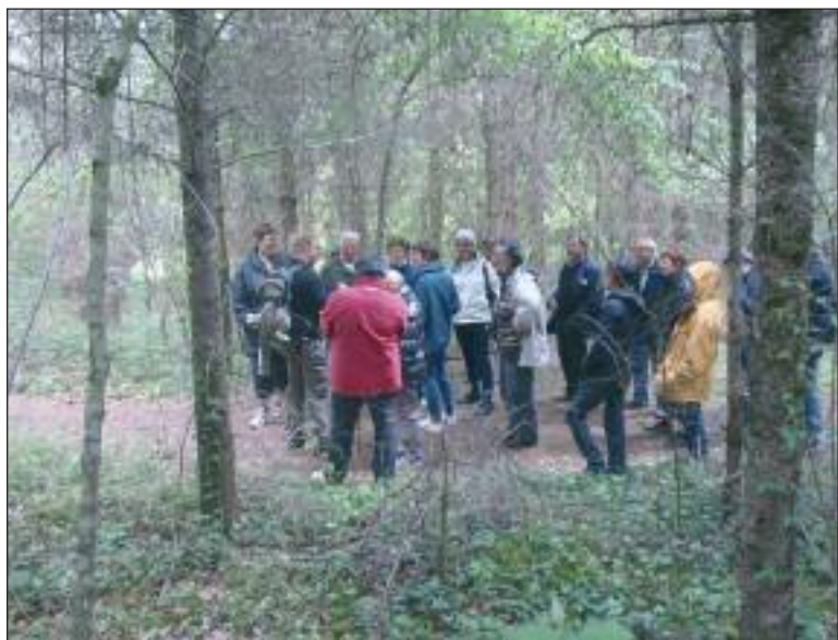
A la découverte des orchidées sauvages