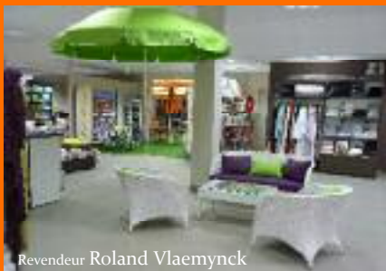
Revendeur Roland Vlaemynck

STORES Extérieur PARASOLS Bain de soleil