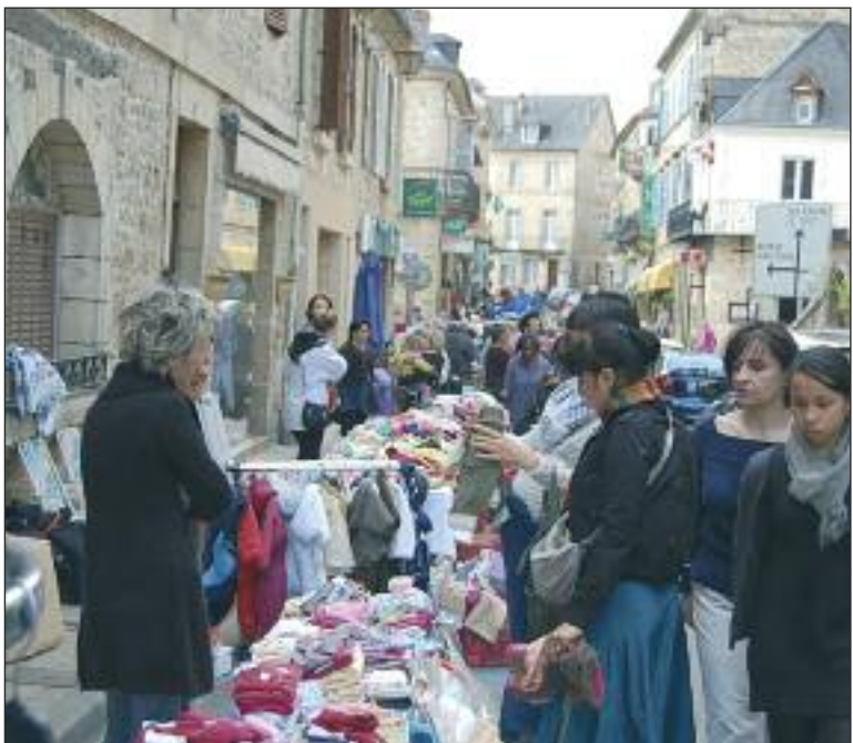
Beaucoup de linge et de vêtements