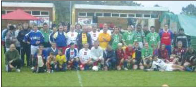
Toutes les équipes réunies