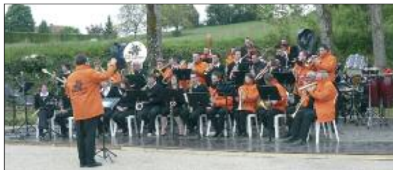
Les Griffons de Saint-Brieuc